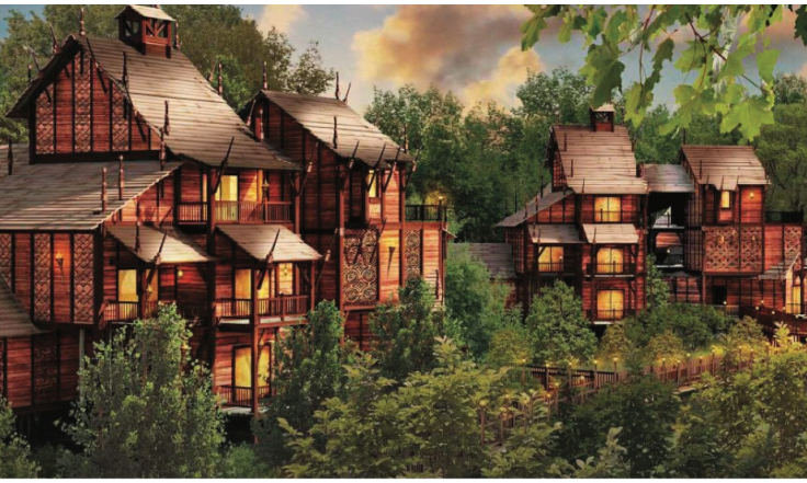
La Cité Suspendue au Parc Astérix