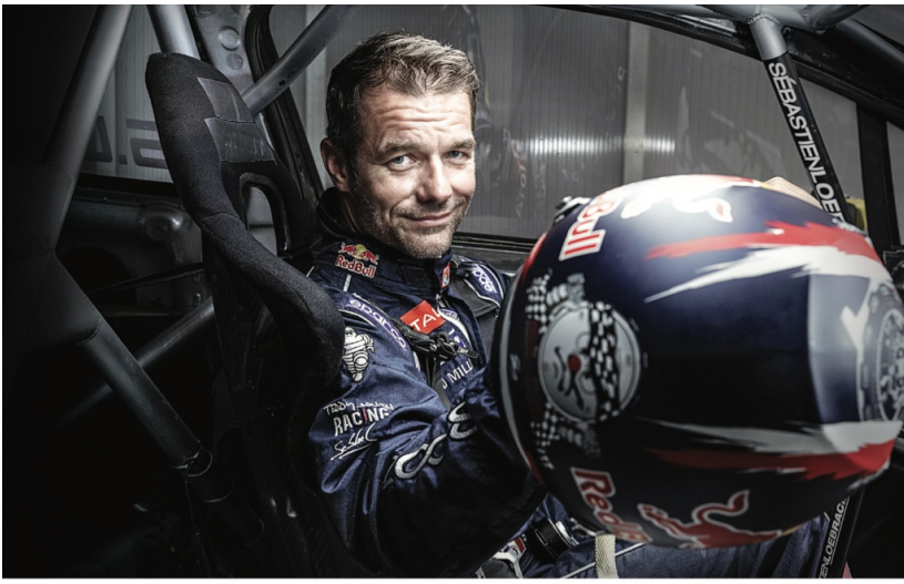
Nouvelle attraction du Futuroscope avec Sébastien Loeb