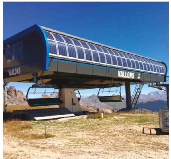
1 420 panneaux photovoltaïques souples Gare des Vallons à Serre-Chevalier

Cette année, Serre-Chevalier a aussi obtenu sa certification Green Globe et vient d'annoncer la mise en place d'un programme pour être la première station à produire 30% de sa propre électricité en combinant les trois énergies renouvelables que sont l' hydroélectricité , le photovoltaïque et le micro-éolien , l'ambition étant de faire de Serre-Chevalier une station totalement engagée dans la transition énergétique.