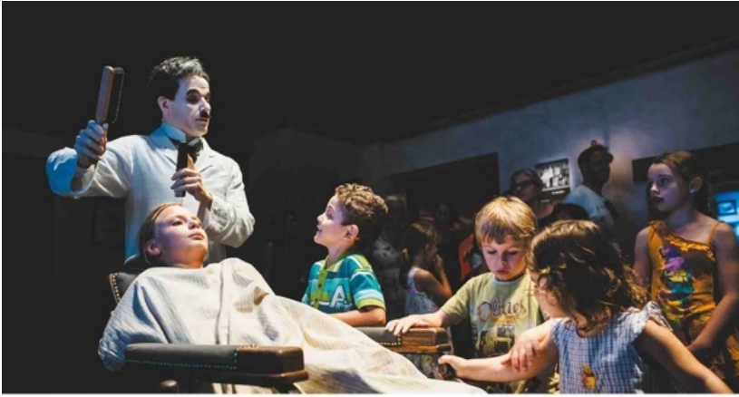
La scène du barbier à Chaplin's World